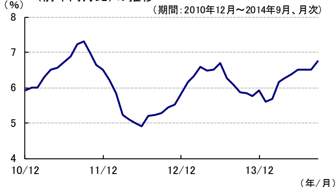
【図3】ブラジルレアルの対円・対米ドルレートの推移