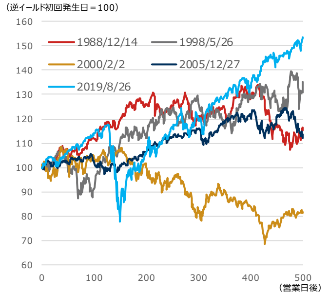
期間：逆イールド初回発生日を0営業日としたその後500営業日、日次 ・逆イールドとは短期金利が長期金利を上回る状態を指す。今回は米2年国債利回り（短期金利）と米10年国債利回り（長期金利）を比較した ・1988年以降過去5回の逆イールド示現局面のS&P500種株価指数の動き